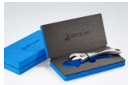
Personalisierte Etuis mit feinsten Gravuren