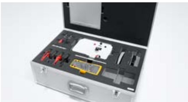
Sicher geschützte Werkzeuge und Bauteile