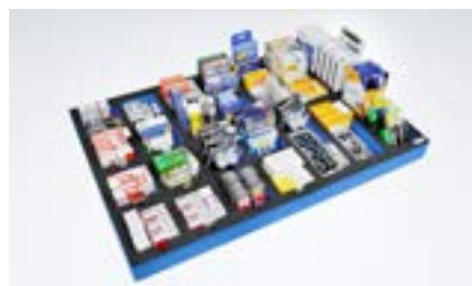
Ordnungssystem für Büroutensilien