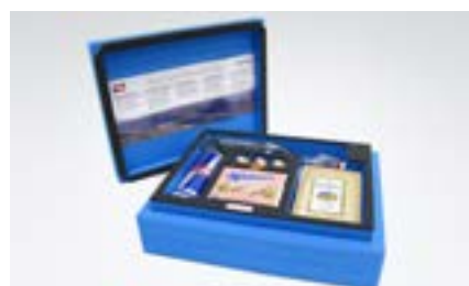
Kundengeschenke mit Stil