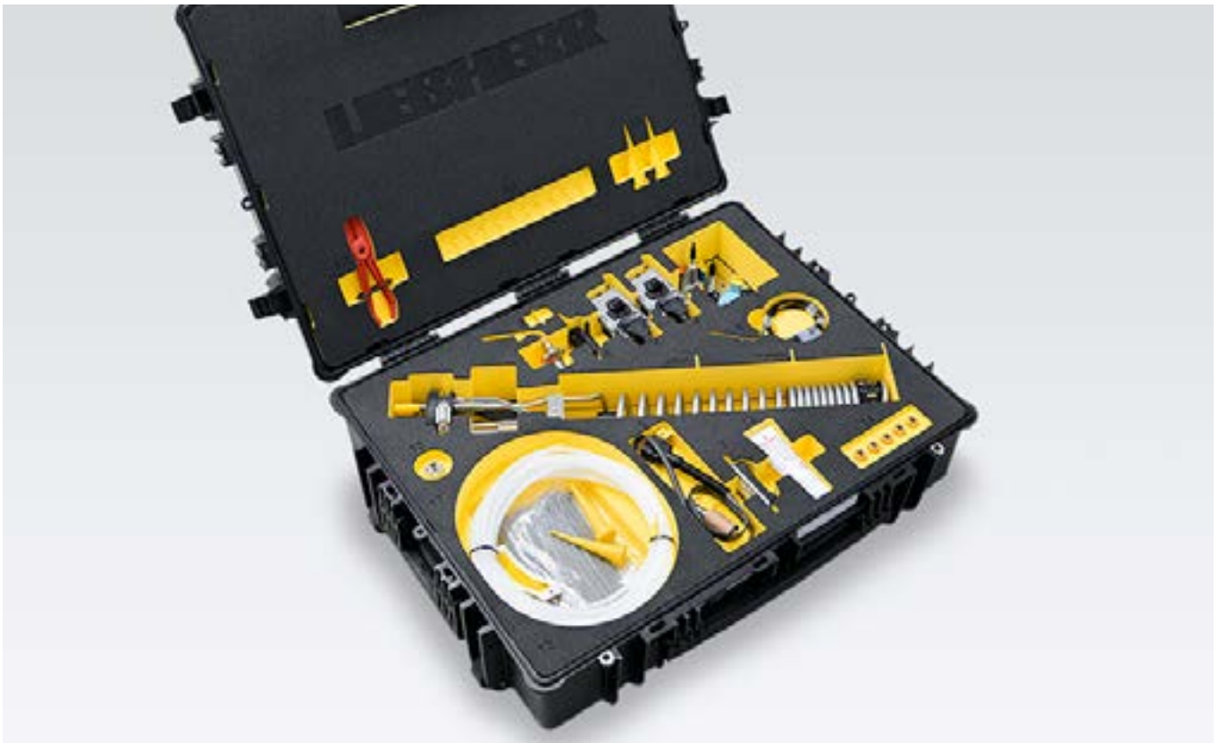
Optimal verpackt und handlich für unterwegs