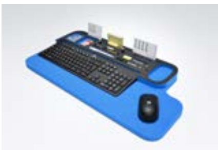
Auflage zur Schreibtischorganisation