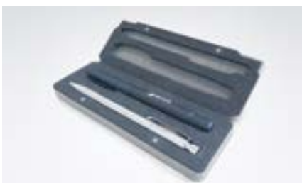
Etuis für Stifte