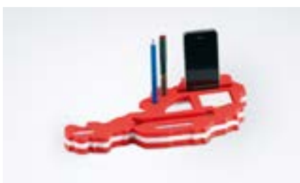
Präzise Umsetzung von Details