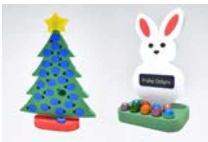
Ausgefallene Give-aways und Präsente